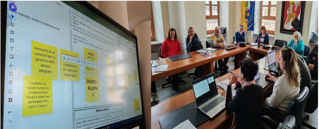
Incontro del 28 aprile 2026 presso il Municipio di Doues