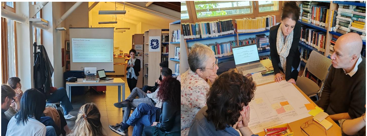
Incontro del 21 aprile 2026 presso la Biblioteca Comunale di Quart