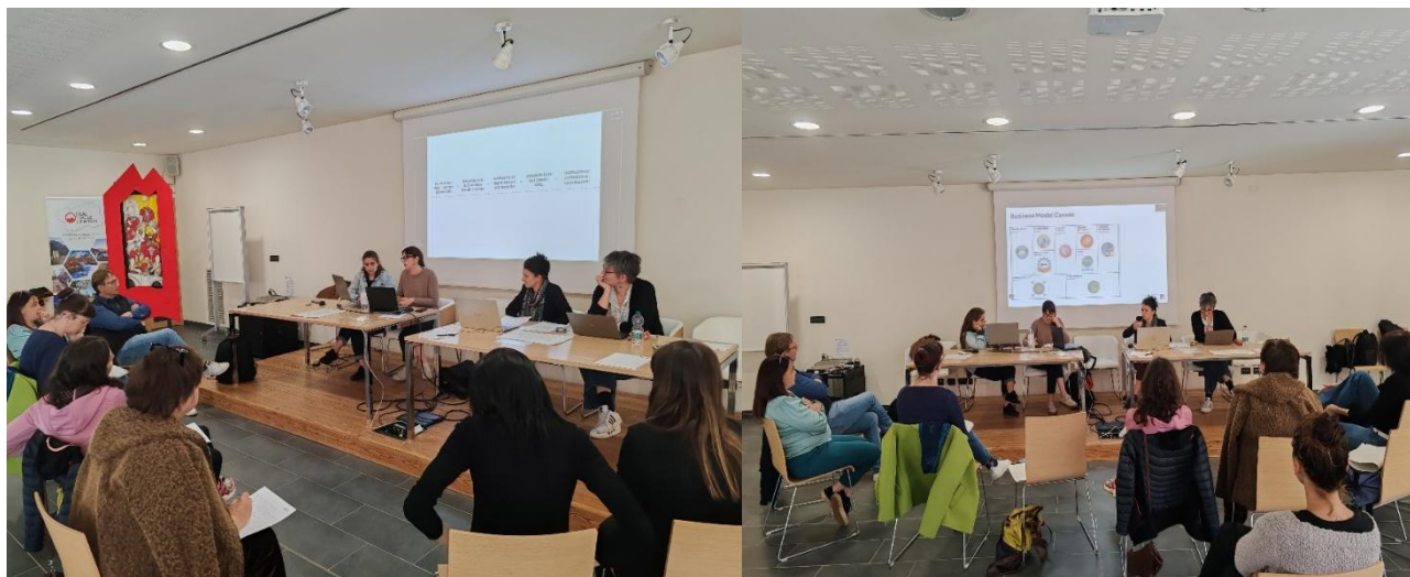
Incontro del 24 aprile 2026 presso il Salone Espace polivalente di Champorcher