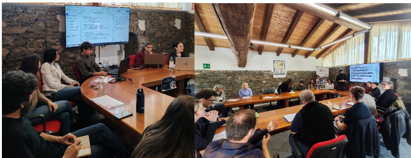
Incontro dell'11 maggio 2026 presso il Municipio di Montjovet