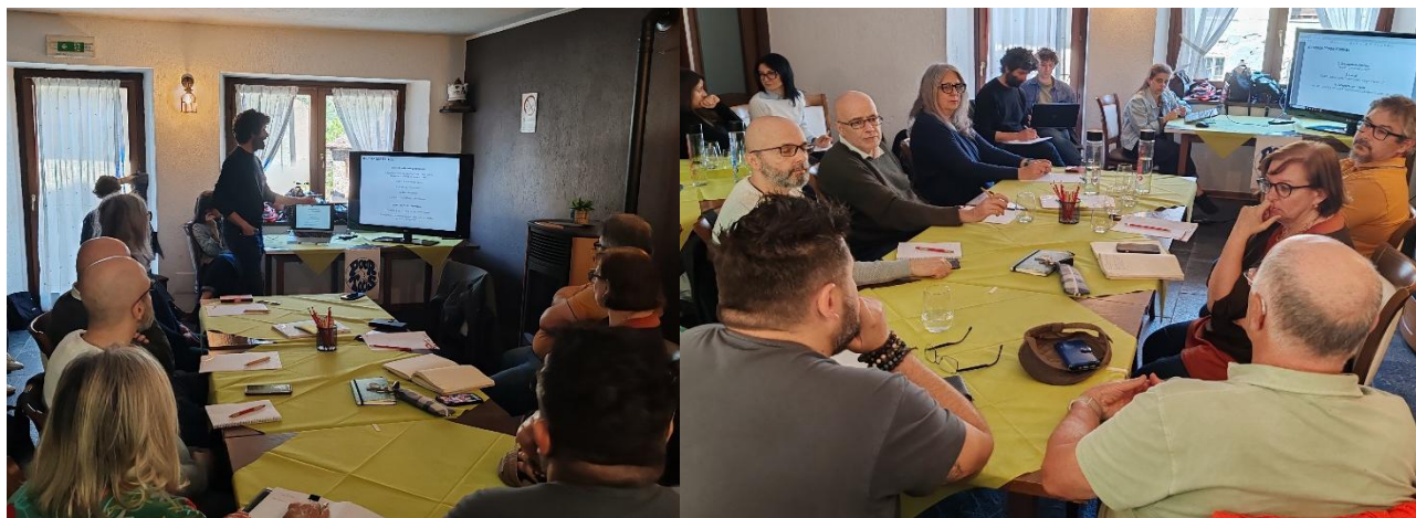
Incontro del 21 aprile 2026 presso l'Osteria al Castello di Saint-Marcel