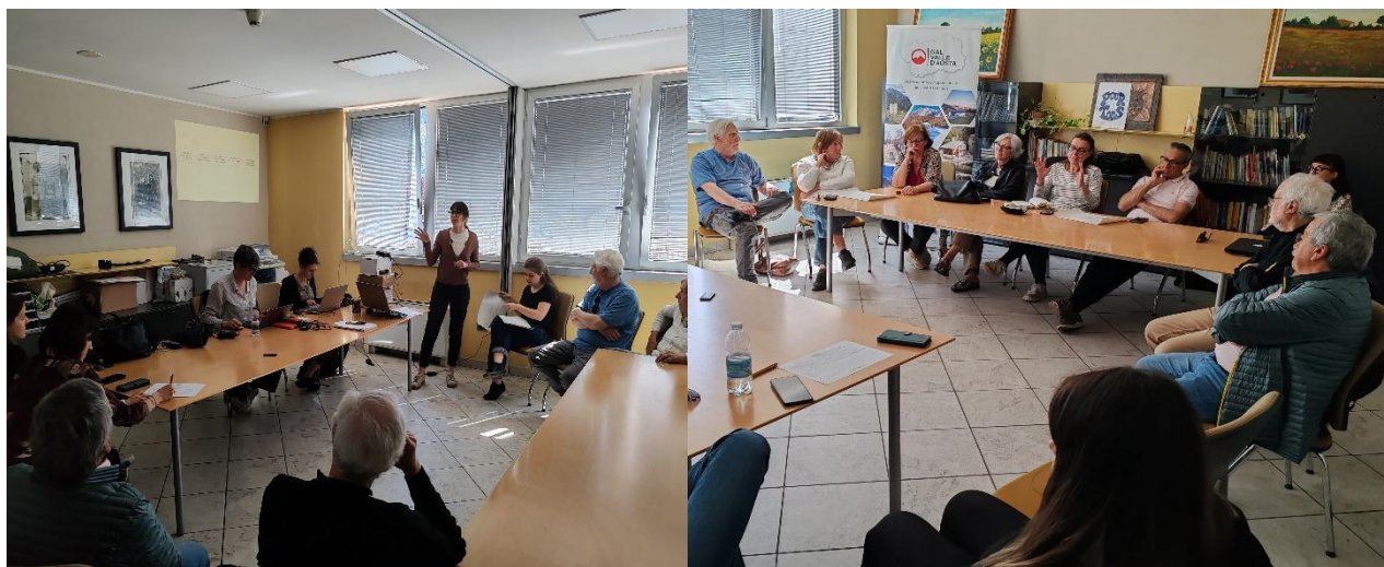
Incontro del 24 aprile 2026 presso la sede della Coop. La Libellula a Saint-Christophe